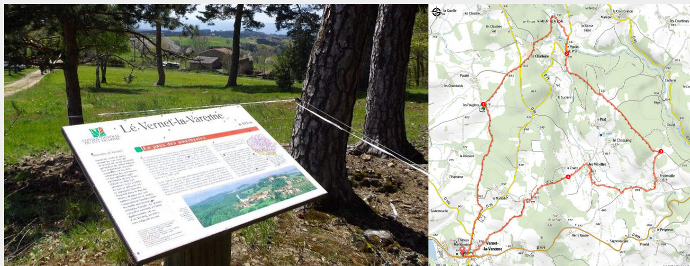
table de lecture au vernet la varenne

Découvrez ce superbe circuit sur la commune du Vernet la Varenne avec des points de vues magnifiques sur la Chaîne des Puys et le Massif du Sancy. Vous traverserez également le ruisseau du Veysson